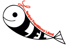
Literární Františkovy Lázně z.s.